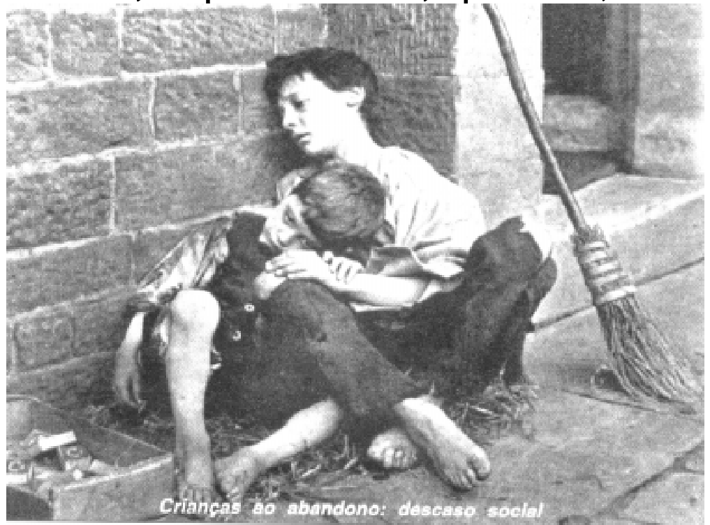
Crianças ao abandono: descaso social

“O silêncio interior é a oração que fazem os grandes homens.”